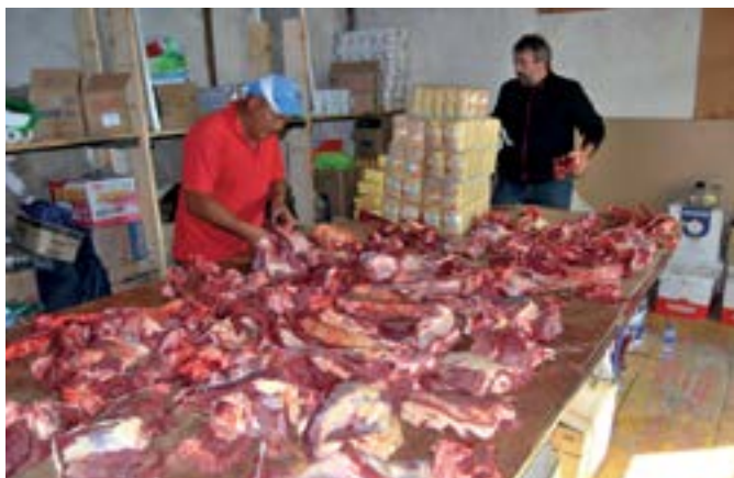
↑ Mäsiarstvo na mongolský spôsob.