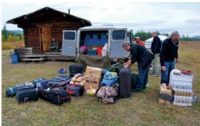
↑ Toto všetko + sedem pasažierov vojde do UAZ-u.