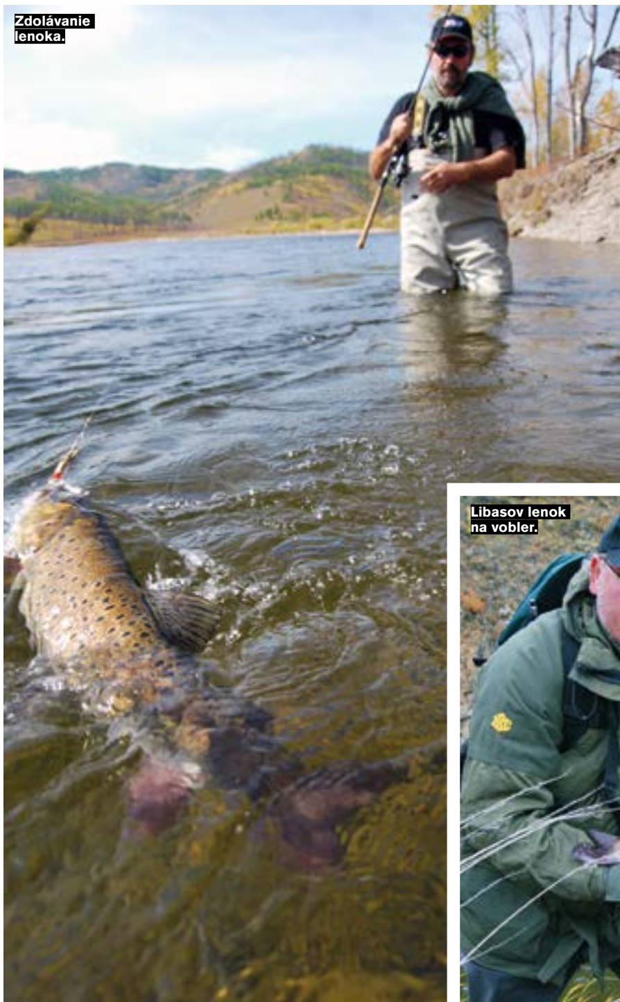
Libasov lenok na vobler.