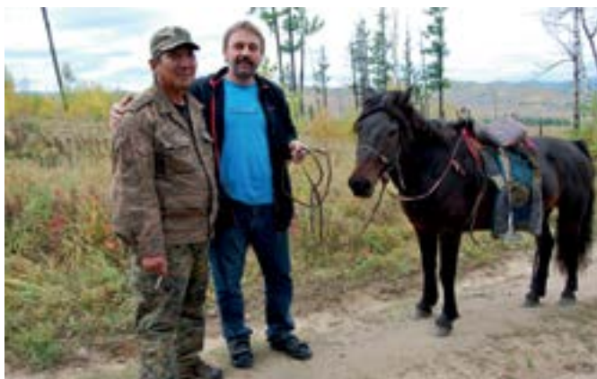
↑ Zvitanie s pohraničníkom (ten vľavo).