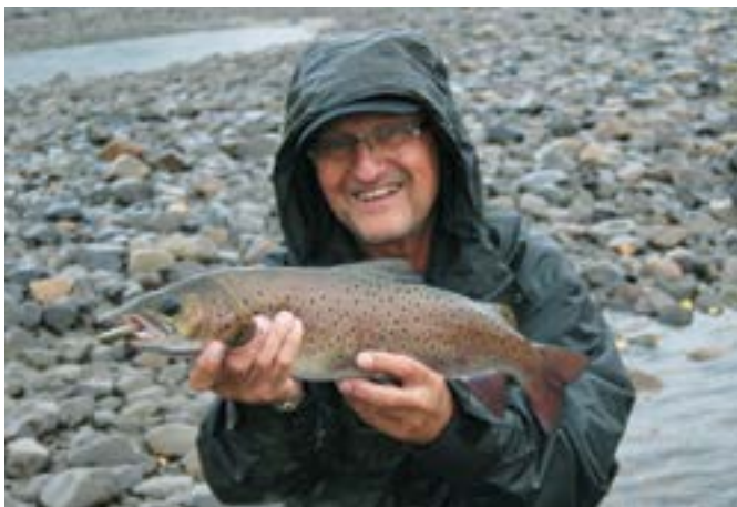
↑ Pstruh sibírsky.