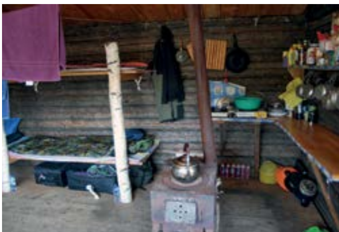
↑ Kuchynský kút v zrubu.