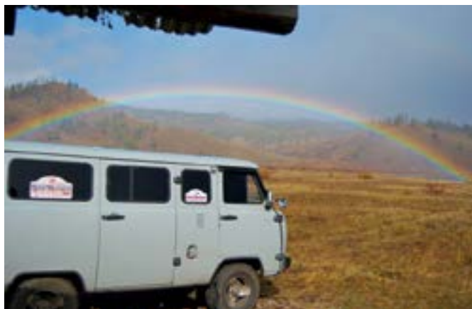
↑ Zlatá brána otvorená...