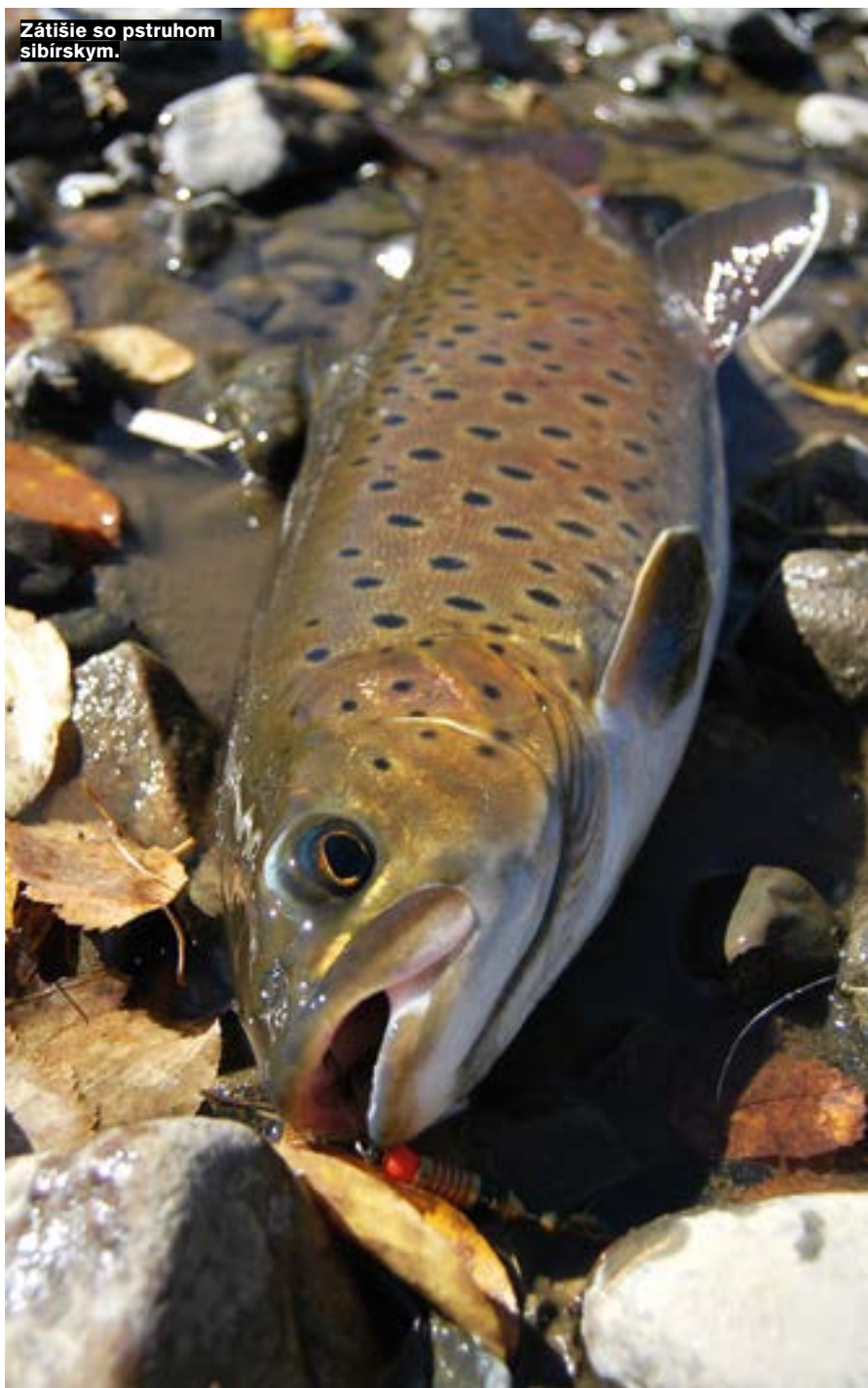
Zátišie so pstruhom sibírsnym.